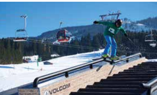
Skigebiet an der Alpspitzbahn mit Snowpark und AlpspitzCOASTER

Wir freuen uns sehr, in diesem Jahr wieder Gastgeber zu sein und wünschen allen Teilnehmern von Jugend trainiert für Olympia & Paralympics viel Erfolg und Spaß!