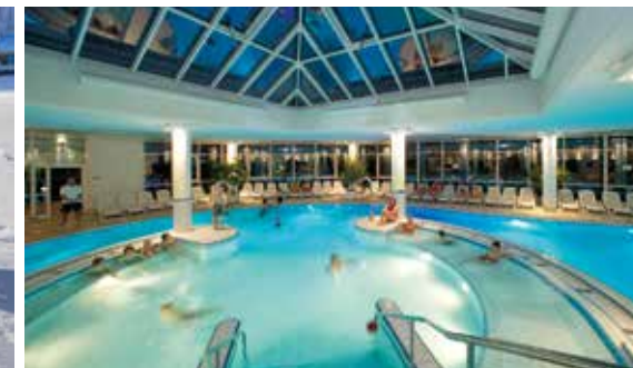
Erlebnisbad Alpspitz-Bade-Center mit Crazy Bob und Saunalandschaft