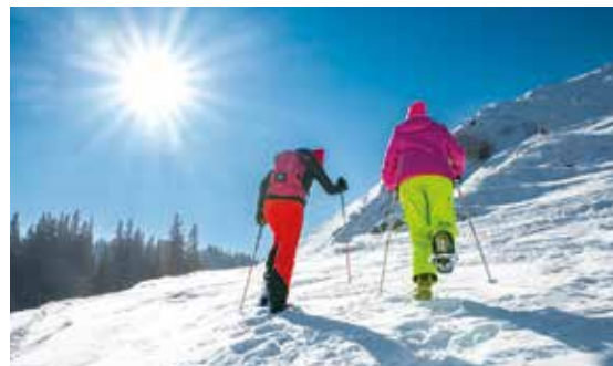
Langlaufen, Winterwandern und Schneeschuhlaufen