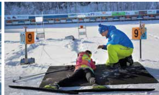
Biathlon-Anlage im Trendsportzentrum Allgäu