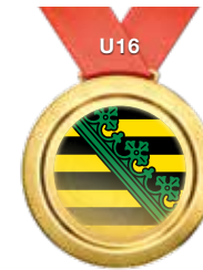
Eliteschule des Wintersports Oberwiesenthal