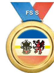
ÜFZ SEHEN MV in Neukloster